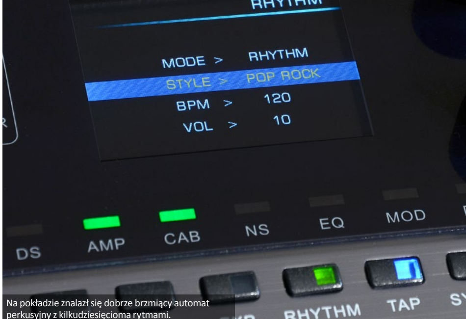
Na pokładzie znalazł się dobrze brzmiący automat perkusyjny z kilkudziesięcioma rytмами.