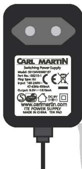
Model. 08210-1 EURO Plug type