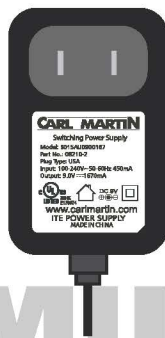
Model. 08210-2 USA Plug type