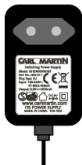
Modèle. 08210-1 Prise européenne