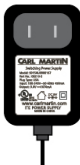
Modèle 08210-2 Prise américaine (USA)