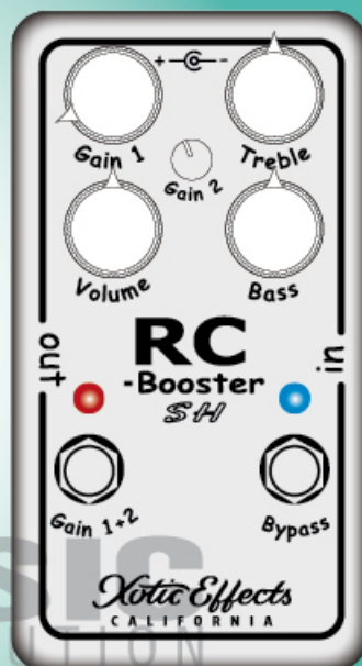
TREMENDOUS BUFFER / BOOST