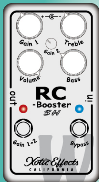
SCOTT'S SIGNATURE SETTING