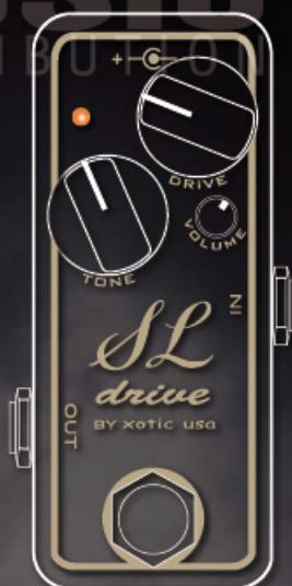
humbucker mr.big 1969