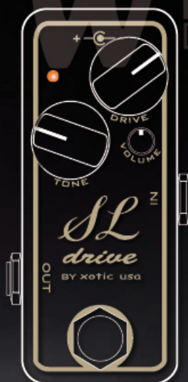
Simple bobinage blackmoresque